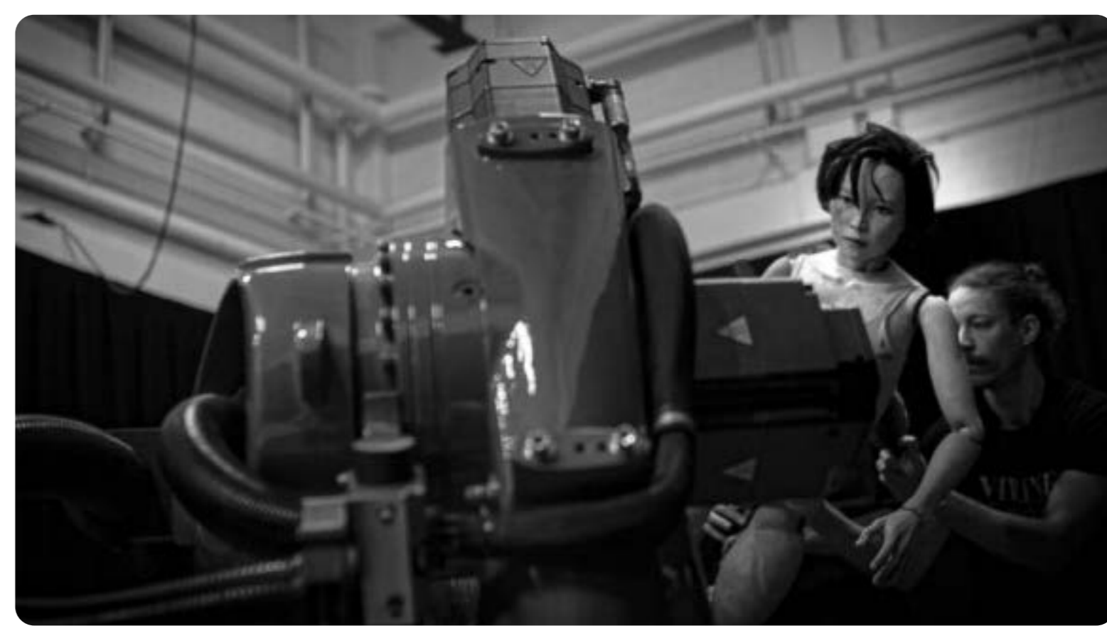
Vooronderzoek de opera ORITO in november 2023.

Met een breed scala aan werken, gekenmerkt door interdisciplinariteit en innovatie, is Ulrike Quade Company al jaren een pionier in het gebruik van nieuwe technologieën en robotica binnen het beeldend theater en poppenspel. Onze unieke benadering, geïnspireerd door de Japanse poppenspeltraditie, waarbij drie personen één pop besturen, zorgt voor een frisse dynamiek en originele creaties.