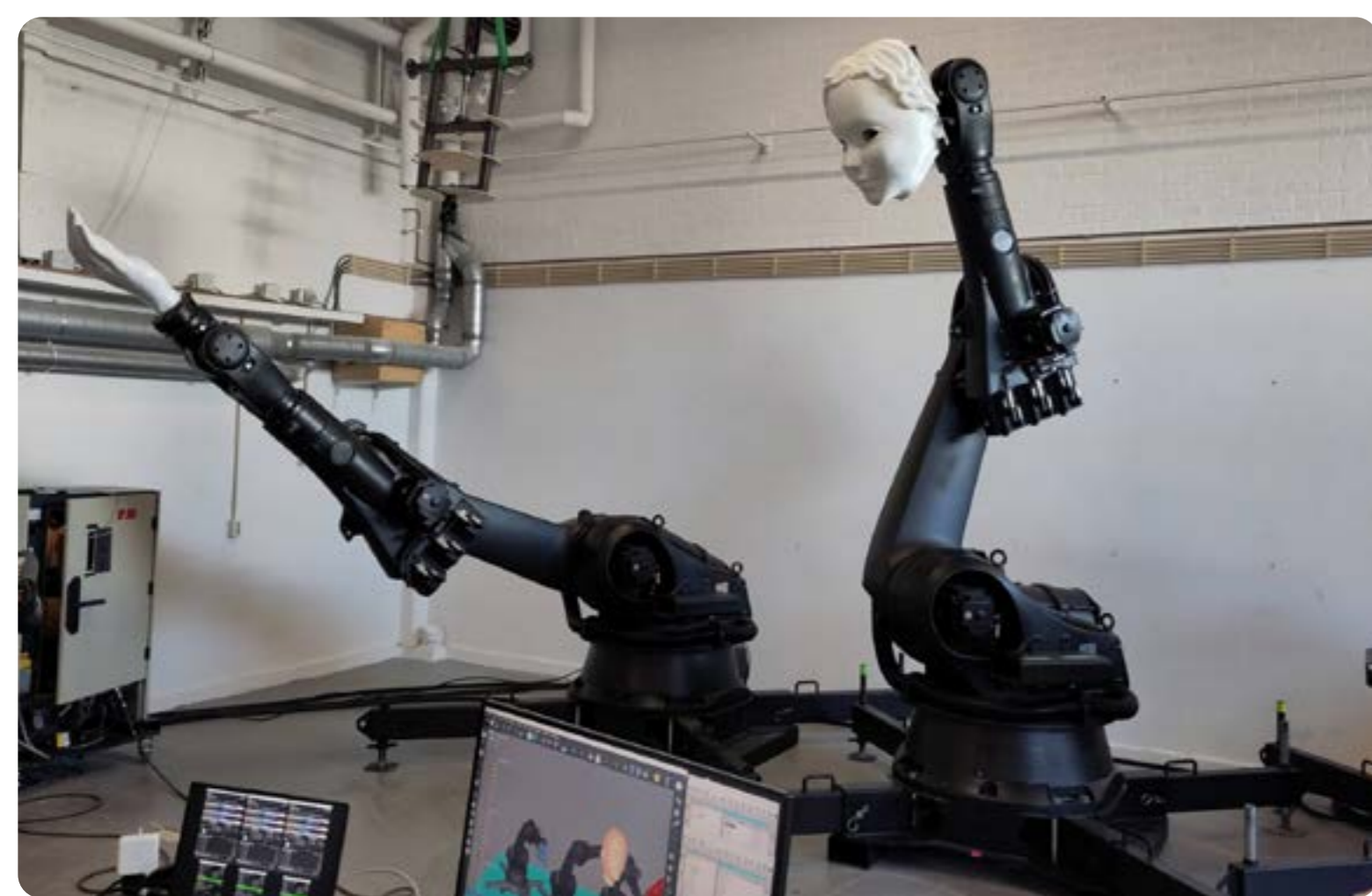
Een Sprintsessie in maart 2023. Onderzoek naar hoe drie kukarobots kunnen samenwerken. We putten hieruit onze poppenspel kennis.

rijke kwesties zoals identiteit, transformatie en technologische ontwikkelingen. Zo deelden we openlijk hoe we door het META-algoritme werden tegengewerkt tijdens onze online campagne voor 'De Foetushemel'. Mede omdat het woord 'abortus' en er foetussen en activisme in onze trailer te zien waren, werden we geflagged en geblokkeerd. Hierdoor werd ons bereik beperkt en konden we uiteindelijk geen advertenties meer plaatsen. Deze ervaring brachten we naar voren in onze interviews en nagesprekken waardoor het gesprek groter werd dan de voorstelling, namelijk: in wat voor maatschappij leven we eigenlijk? En wie of wat bepaalt wat goed of fout is? En wat is onze rol daarin?